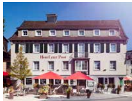
Hotel zur Post