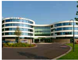
HANSE HOTEL Attendorn

Gerne schicken wir Ihnen unser Gastgeberverzeichnis mit Hotels, Ferienwohnungen, Pensionen und Campingplätzen.