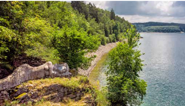
Nixe „Attania“ am Biggensee

Im südlichen Sauerland, im Mittelpunkt der Bundesrepublik Deutschland, befindet sich der Biggensee – Westfalens größter Wasserspeicher. Nur etwa 100 km sowohl von der Weltstadt Köln, als auch von der Metropolenregion Ruhrgebiet entfernt, ist er über die Autobahnen 4 und 45 direkt erreichbar.