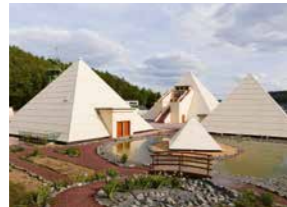
Sauerland Pyramiden, Meggen