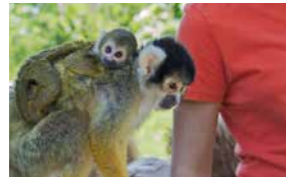
Affen- und Vogelpark