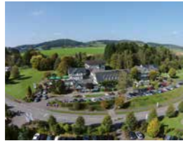
Romantik Hotel Platte