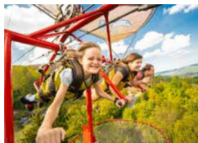
Fort Fun, Bestwig