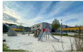
Mehrgenerationen-Spielplatz am JAC Attendorf