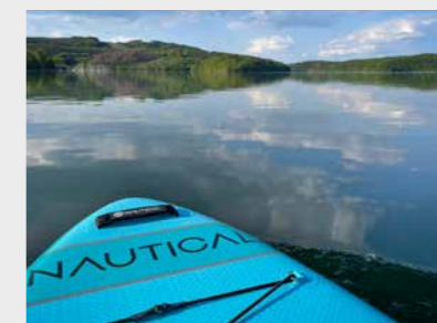
Stand Up Paddling