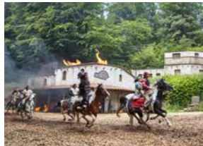
Elspe Festival, Lennestadt