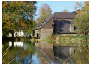
Wendener Hütte, Wenden