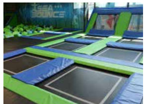
Sea Bounce Olpe