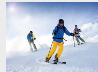
Ski fahren / Rodeln