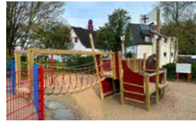
Spielplatz am Südwall