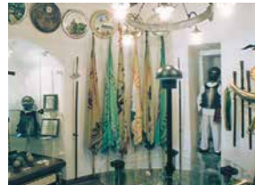
Zeughaus der Schützen