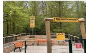
Bläck Fööss Pfad