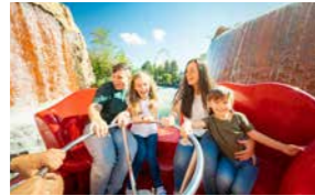
Fort Fun Abenteuerland