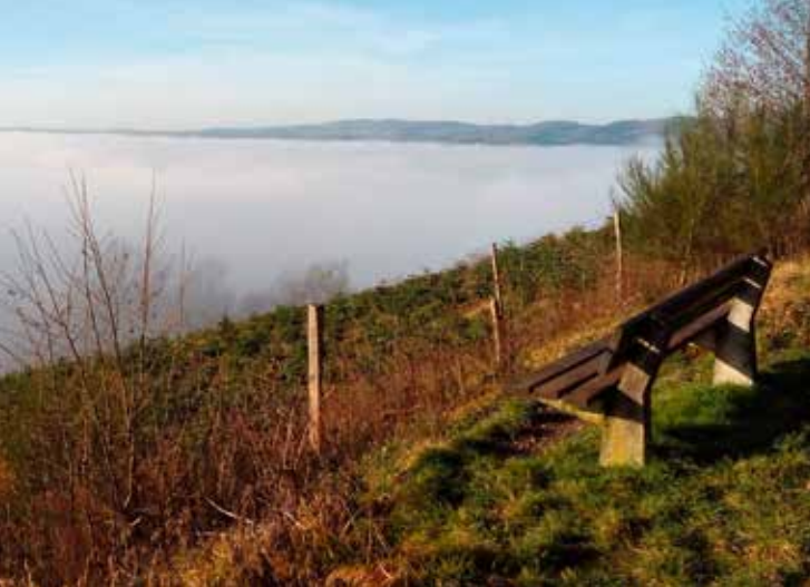
Ausblick beim Wanderweg